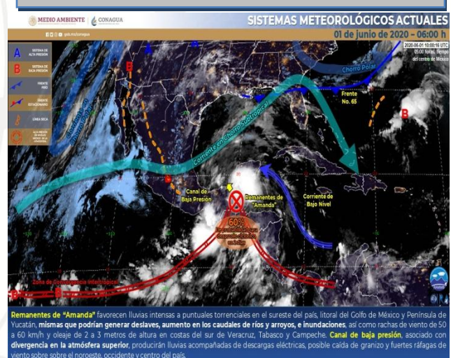
IMAGEN DE SATELITE

Cielo medio nublado durante el día con lluvias puntuales muy fuertes en Puebla, así como lluvias aisladas en Guanajuato, Querétaro, Hidalgo, Tlaxcala y Morelos. Bancos de niebla en zonas montañosas y ambiente frío al amanecer con posibles heladas. Viento de dirección variable de 15 a 30 km/h.